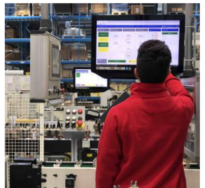
Corso Un giovane del corso Its Academy Meccatronico Veneto

ca nazionale e terzo per categoria) è il Tourism Hospitality Management, impartito all'Its Academy del turismo veneto del Carnacina di Bardolino. Poi il corso per i tecnici per l'automazione, dell'Its Meccatronico. Efficace la proposta dell'Its Buttapietra, che forma professionisti nell'agroalimentare, specializzati in filiera bio. Infine Its Red forma con successo in città Energy manager (5° posto su 18 percorsi d'area in Italia), ovvero esperti nel risparmio energetico e nell'utilizzo delle energie green e Building Manager. ● Va.Za.