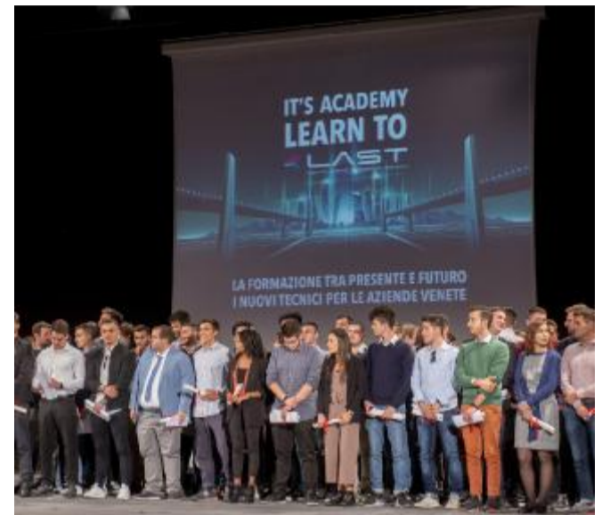
Academy Consegna dei diplomi in logistica dell'Its Last di Verona nel 2019

Le aree su cui gli Its insistono sono l'efficienza energetica, la mobilità sostenibile, le nuove tecnologie della vita e il biomedicale, le tecnologie per il made in Italy, quelle per i beni e le attività culturali, dell'informazione e della comunicazione, passando per la moda, la meccanica, l'agro-alimentare, i servizi alle imprese e il sistema casa. «Insomma, tutto quello che oggi serve a migliaia di aziende e che migliaia di ragazzi possono imparare a fare in modo innovativo», conclude l'ad. ●