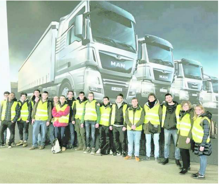
Gli studenti dell'Istituto Last, come loro "colleghi" degli altri istituti, usano corsi di stage nelle aziende che poi possono assumerli